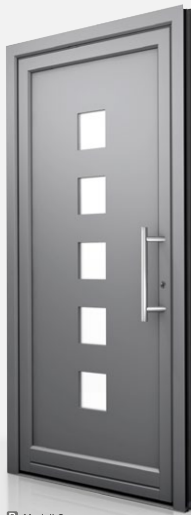
P Modell G

U_b = 1,5 \text{ W/m}^2\text{K} Farbe: HM304 Griff: HS10 Glas: Satinato weiß