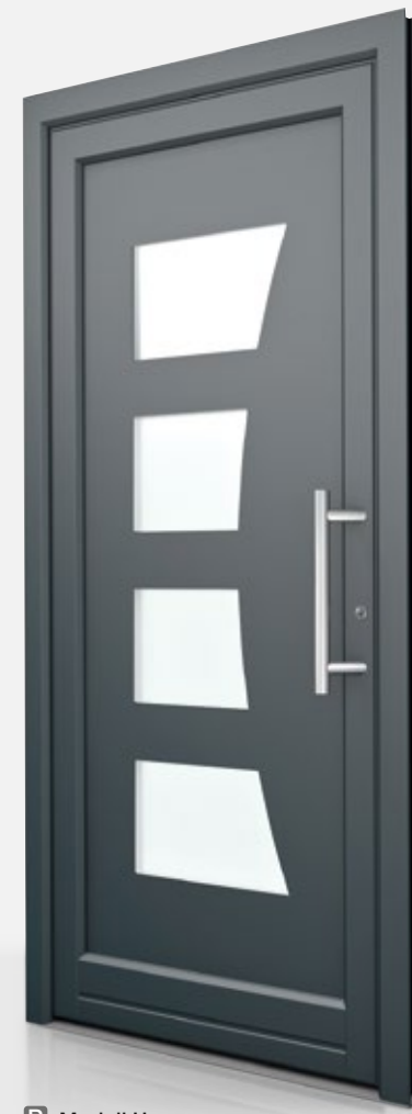
P Modell H

U_b = 1,5 \text{ W/m}^2\text{K} Farbe: HM907 Griff: HS10 Glas: Satinato weiß